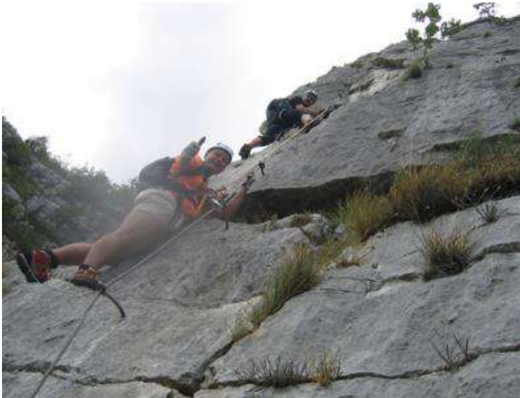
Tiefblicke auf den Gardasee