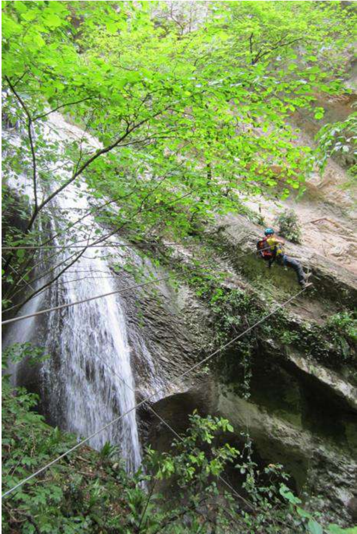
Wolfgang auf der 3-Seil-Brücke des Rio Sallagoni