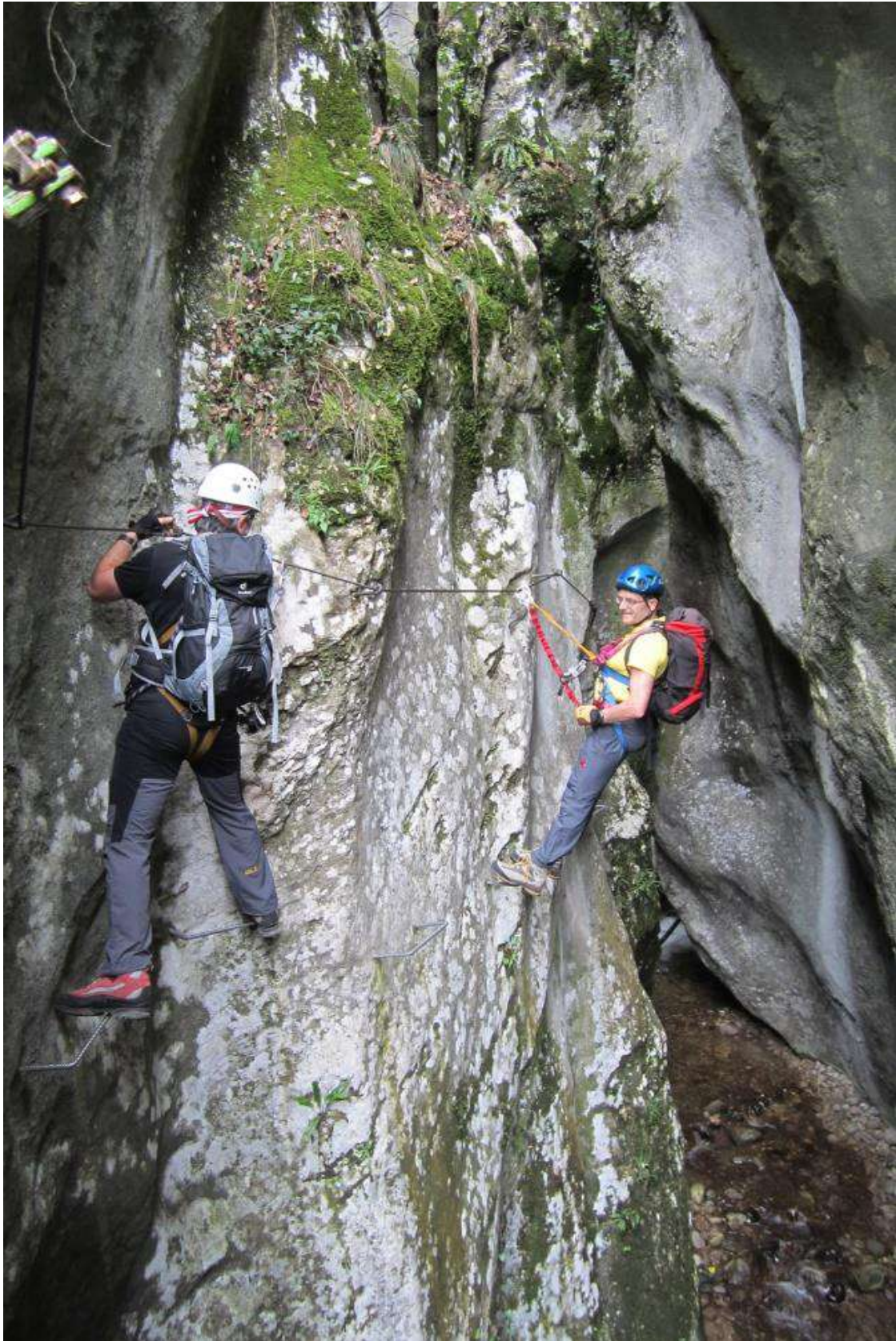
In der Schlucht des Rio Sallagoni