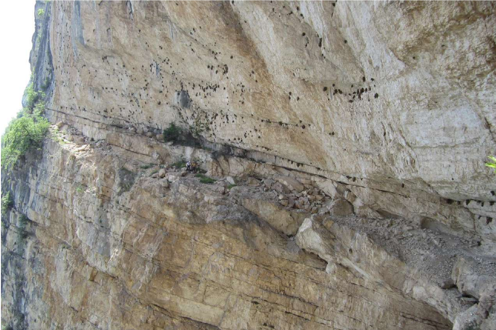
Kleine Menschen in dem Riesen-Gemäuer der Ferrata Gerardo Segà