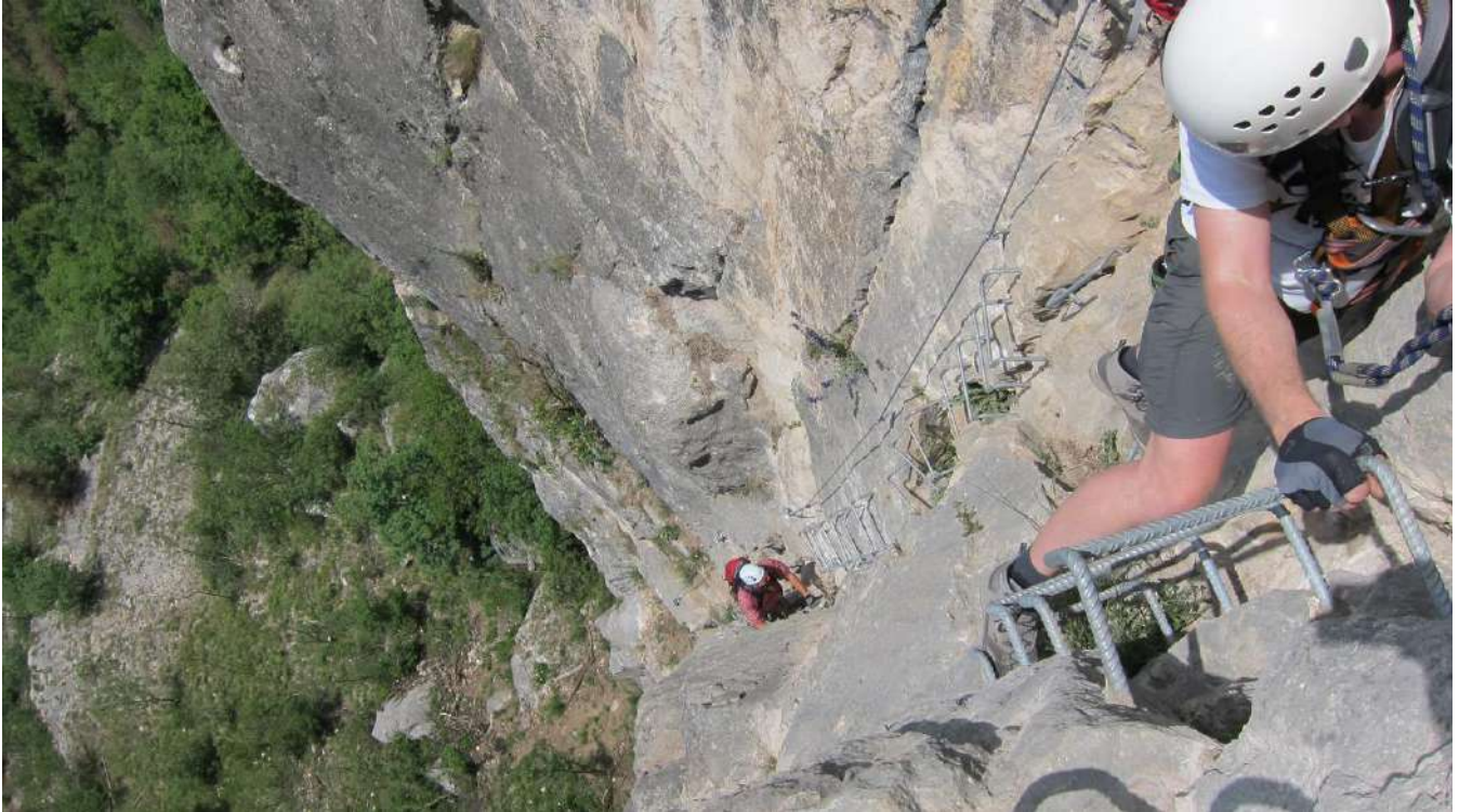
Im Sentiero dei Banditi, immer direkt oberhalb des Seeufers

2014 Gardasee-Berge In der Steilwand der Via Ferrata Monte Albano